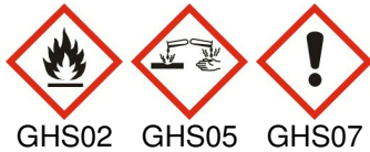
GHS02 GHS05 GHS07